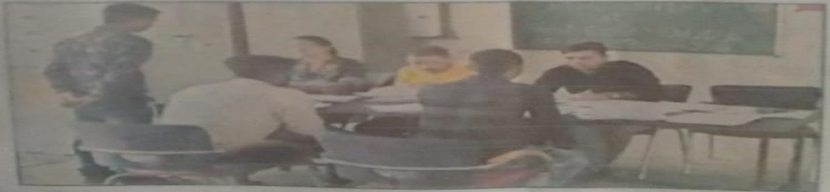
आईटीआई में आयोजित कैपस इंटरव्यू में भाग लेते छात्र।

2017 और 2018 में इलेक्ट्रीशियन, इलेक्ट्रानिक्स, पीपीओ, सीओई, कोपा, आईटी और फिटर मैकेनिकल व अन्य व्यवसायों में कोर्स पूरा कर चुके 550 छात्र छात्रों ने भाग लिया। श्री शर्मा ने कहा कि उनका मुख्य उद्देश्य सभी युवाओं को रोजगार प्राप्त करवाना है ताकि वे भविष्य में अपना और अपने परिवार का पालन पोषण कर सकें और साढौरा आई टी आई का नाम पूरे देशभर में हो।