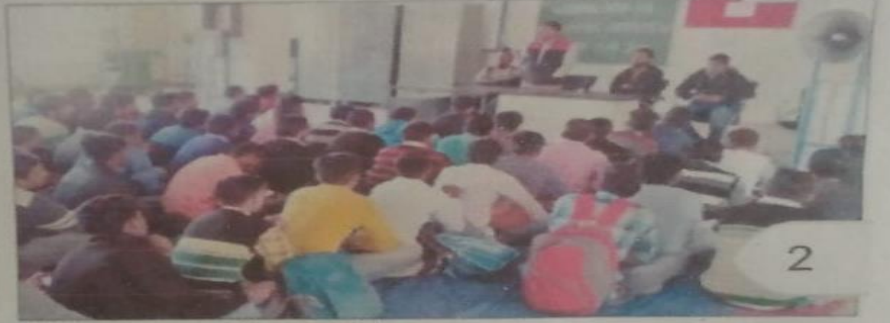
कैम्पस इंटरव्यू में भाग लेते छात्र