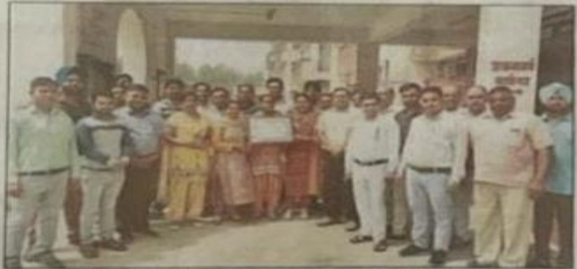
आईटीआई प्रबंधक स्टाफ के साथ प्रमाण पत्र दिखाने हुए।

उन्होंने कहा कि आईटीआई में तकनीकी रूप से विद्यार्थियों को पूरी सुविधाएं दी जा रही हैं। वहीं समय-समय पर विद्यार्थियों की प्लेसमेंट के लिए कंपस ट्राइव के साथ सभी पहलुओं पर जगजगता की जाती है। उन्होंने कहा कि हम अपने प्रयास ऐसे ही जारी रखने हुए आईटीआई को ऊंचाई पर ले जाएंगे। हमारा लक्ष्य देश के सर्वोत्तम संस्थानों में से एक बनना है। तब तक कच्चे तथा अकारगर क्षेत्र के युवाओं को उनके बेहतर व उज्ज्वल भविष्य के लिए प्रशिक्षण व रोजगार संबंधी सुविधाएं उपलब्ध करवाई जा सकें। इस अवसर पर उन्होंने सभी स्टाफ सदस्यों व छात्र छात्राओं को बधाई व शुभकामनाएं दीं।