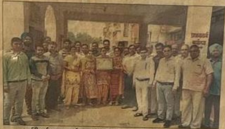
आईटीआई प्रधानाचार्य स्टाफ के साथ प्रमाण पत्र दिखाते हुए।

उन्होंने कहा कि आईटीआई में तकनीकी रूप से विद्यार्थियों को पूरी सुविधाएं दी जा रही हैं। वहीं समय-समय पर विद्यार्थियों को प्लेसमेंट के लिए कैंपस ट्राइव के साथ सभी पहलुओं पर जागरूकता की जाती है। उन्होंने कहा कि हम अपने प्रयास ऐसे ही जारी रखते हुए आईटीआई को ऊंचाई पर ले जाएंगे। हमारा लक्ष्य देश के सर्वोत्तम संस्थानों में से एक बनना है। ताकि कच्चे तथा आसपास क्षेत्र के युवाओं को उनके बेहतर व उज्ज्वल भविष्य के लिए प्रशिक्षण व रोजगार संबंधी सुविधाएं उपलब्ध करवाई जा सके। इस अवसर पर उन्होंने सभी स्टाफ सदस्यों व छात्र छात्राओं को बधाई व शुभकामनाएं दीं।