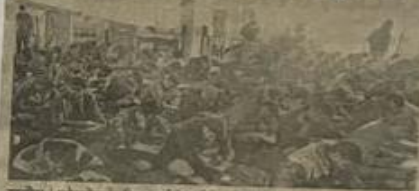
सादीस | प्लेसमेंट के लिए आईटीआई में परीक्षा हुई।